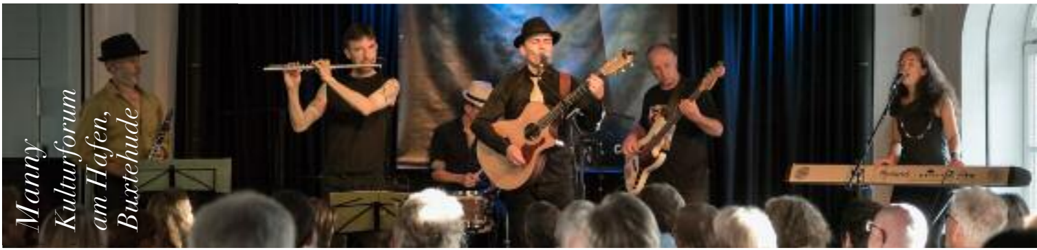
Manny Kulturforum am Hasen, Buxtehude