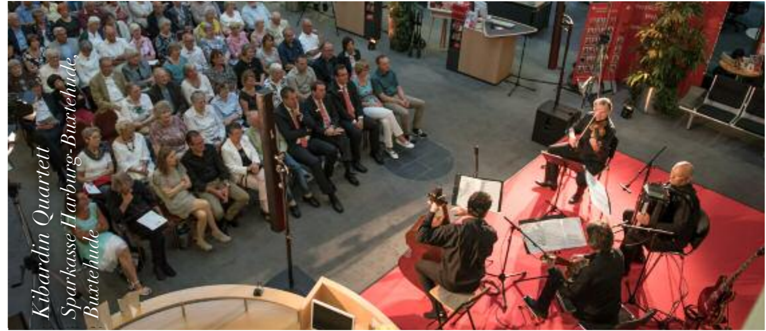
Kibardin Quartett Sparkasse Harburg-Buxtehude, Buxtehude