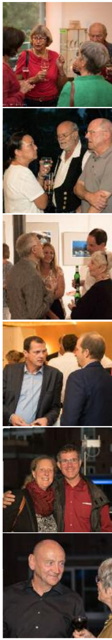
Freunde · Gäste · Mitarbeiter · Künstler · Zuschauer · Zuhörer · Publikum