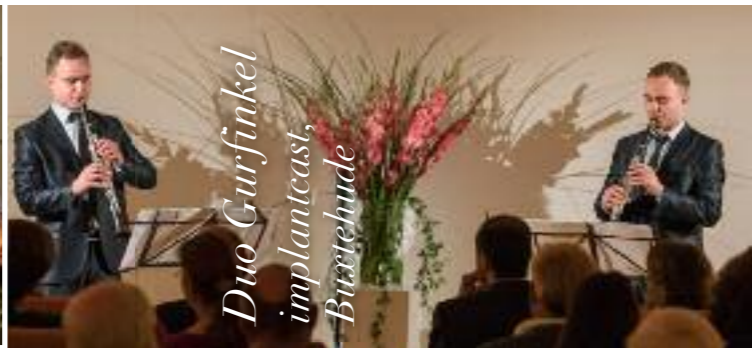
Duo Gurfinkel implantcast, Buxtehude